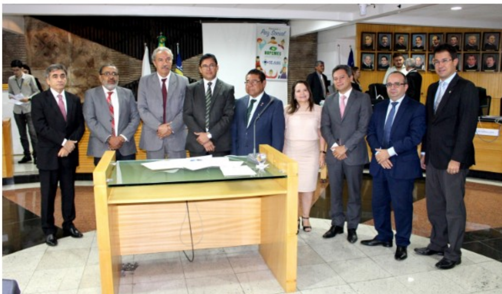
TJ-PI e MPE-PI firmam parceria