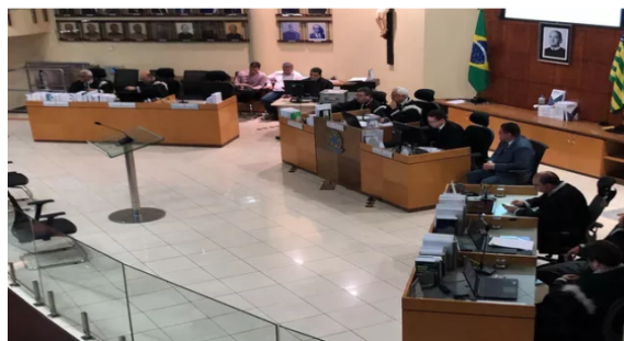
TRE-PI determina nova eleição no município de Brasileira