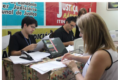
Semana Nacional de Conciliação

Em média são registradas 35 audiências por dia, que acontecem no Fórum de Teresina, juzizados especiais e nas faculdades de direito. A semana tem o intuito agilizar o andamento de processos. "Aqui na comarca de Teresina estamos com 537 audiências agendadas em diversos processos nas varas de famílias, como pensões, divórcios, tem as ações possessórias nas áreas civis e tem ações de demandas de condomínios", disse o desembargador Olímpio Galvão.