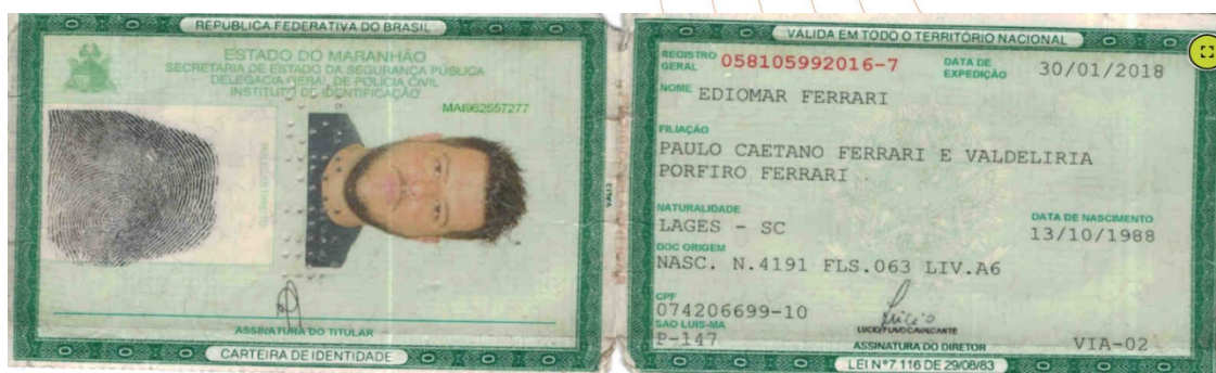
IMAGEM 2. RG CADASTRADO NO BANCO DE CADOS DO CCN.

Diante dos indícios de tentativa de pratica de crime registrou-se Boletim de Ocorrência Nº 24914/2023, registrado em 26 de janeiro de 2023 às 15h e