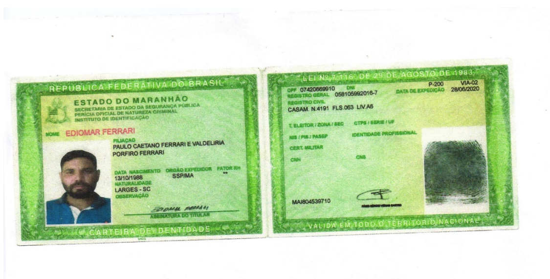
IMAGEM 1. RG APRESENTADO PELO CLIENTE.