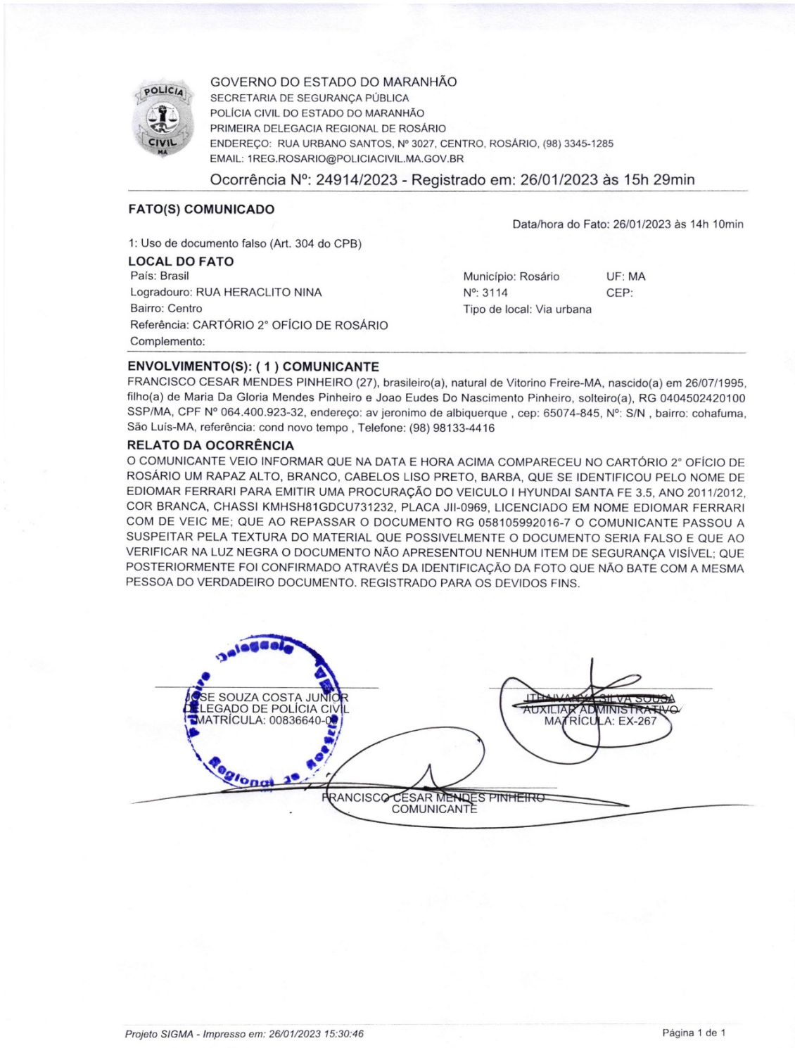
IMAGEM 3. BOLETIM DE OCORRÊNCIA.

29min, na Delegacia de Polícia Civil de Rosário/MA, para dar ciência sobre o acontecido. Abaixo anexo boletim.