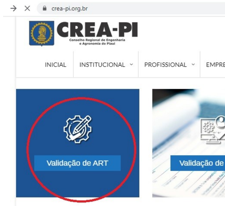
Imagem 2 - Página inicial do sítio eletrônico do CREA-PI

Nesse contexto, eventual exigência de reconhecimento de firma aposta em ART já registrada junto ao CREA mostra-se inútil e desnecessária, constituindo ônus descabido para o usuário do serviço extrajudicial.